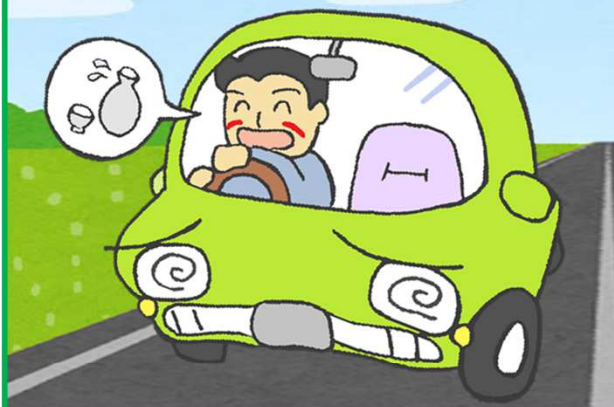
飲酒運転事故 時間帯別 発生件数 (過去5年・平成31年～令和5年)