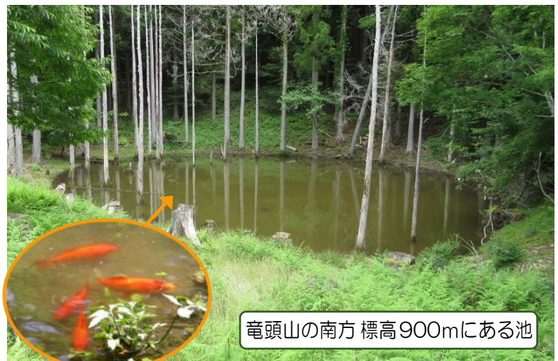
竜頭山の南方 標高900mにある池

竜頭山の南方に大きな池があります。この池は不思議なことに、沢などの水が流れ込んでいないのに水がたまっています。しかもたくさんの金魚を見ることができます。地元の方々は「あの辺りの高い山にある池は、あそこだけだね、金魚はだれかが入れたね。」と笑いました。