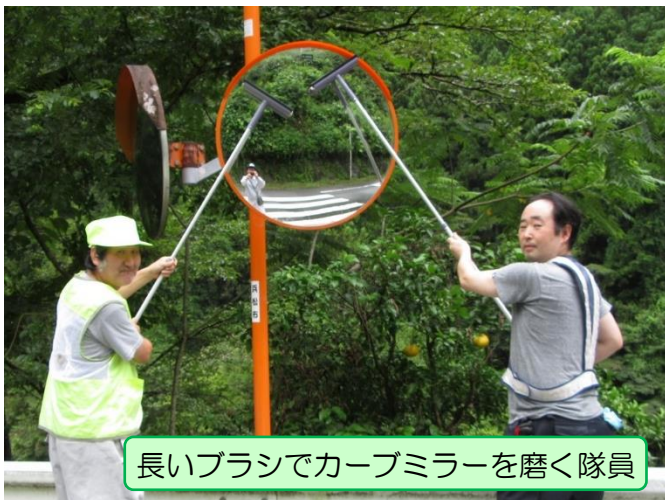
長いブラシでカーブミラーを磨く隊員

佐久間町になくてはならない物にカーブミラーがあります。そんなカーブミラーの清掃作業を7月14日、交通安全協会山香方面隊が行いました。北遠のカーブミラーは、杉などの花粉で汚れおり花粉にやられるのは人間だけではないようです。