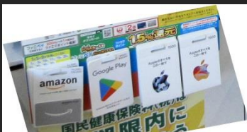
コンビニ販売の電子マネー