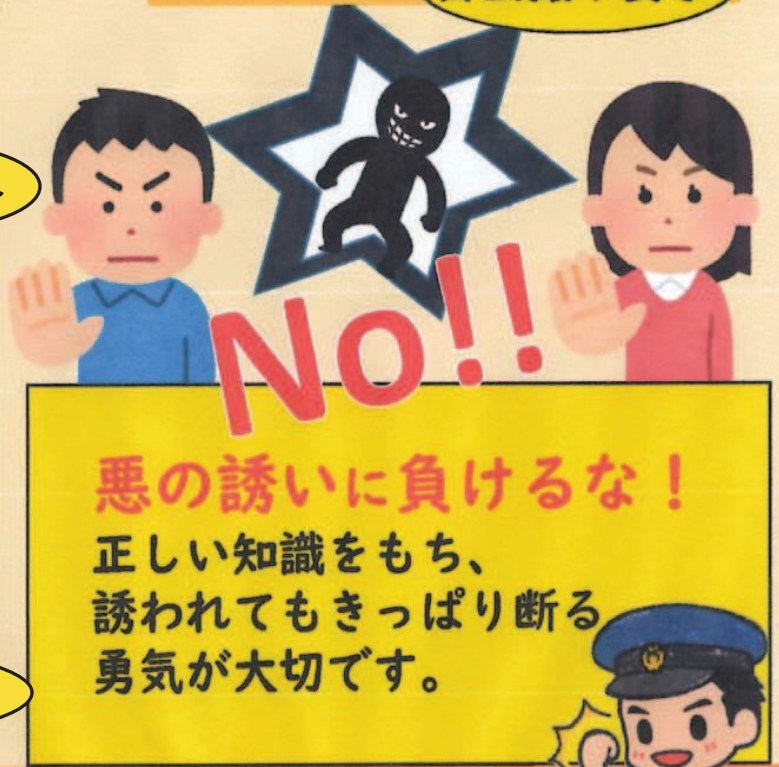
詐欺グループの仲間!