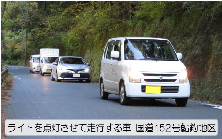
ライトを点灯させて走行する車 国道152号鮎釣地区

日照時間の短い季節となりました。この季節は太陽が空高く昇らず、日差しは南の空から斜めに差します。そうすると山の中を走る北遠の道路は、昼間でも薄暗く視界が悪くなります。ドライバーのみなさんは自らの存在を周囲に知らせるために、昼間からのライトオンをお願いします。