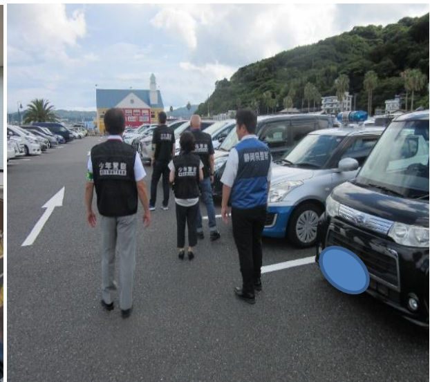
街頭補導活動に繰り出す様子

現在、17名(少年指導委員6名、少年警察協助力員11名)が所属し、少年非行防止活動及び有害環境浄化等の活動を中心に行っています。