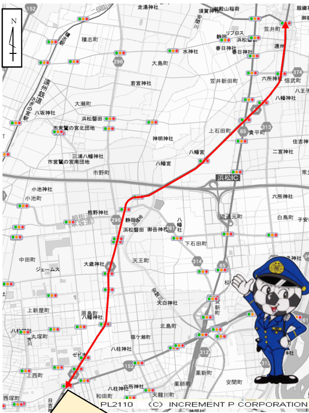
① 重点路線 主要地方道天竜浜松線