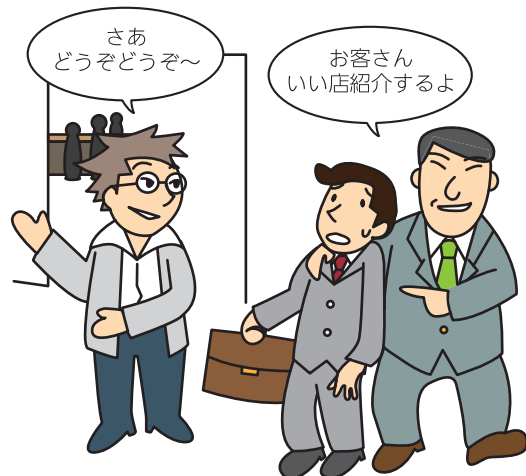
風俗案内所等への客引き