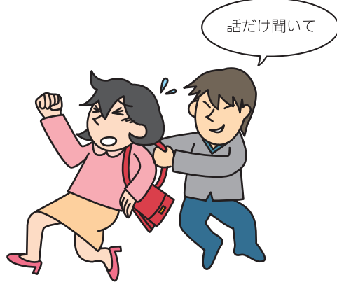
執ような客引き (業種は問いません)