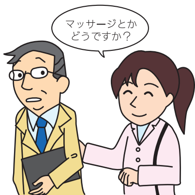
深夜における マッサージ等の客引き