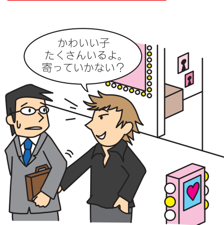
性風俗店・接待飲食店等への客引き (いわゆるフリーの客引き)