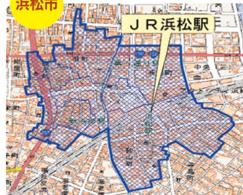
浜松市中央区旭町、板屋町、鍛冶町、肴町、神明町、砂山町、田町、千歳町、伝馬町、平田町、旅館町、連尺町