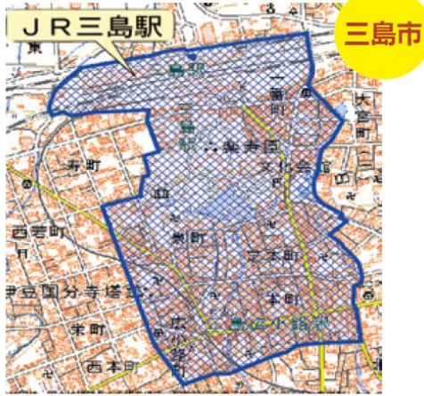
三島市泉町、一番町、本町、芝本町、広小路町