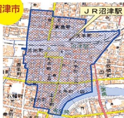
沼津市上土町、大手町1丁目、大手町2丁目、大手町3丁目、大手町4丁目、大手町5丁目、添地町、高島町、町方町