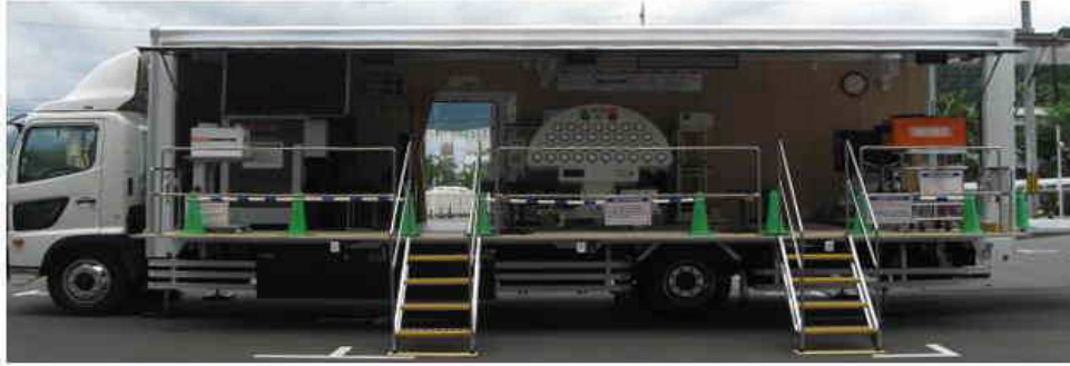
前方 ← 搭載機器配置図 → 後方