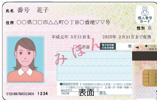
【マイナンバーカード】