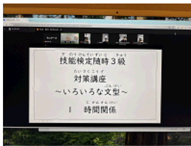
オンライン会場での様子