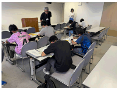
対面式会場での様子