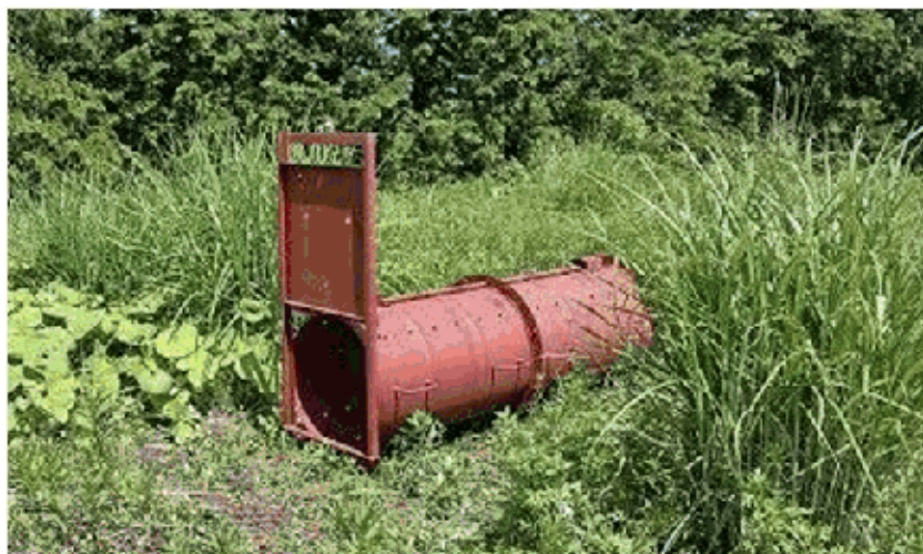
裾野市須山に設置したクマの捕獲わな

また、市街地に出没した際の「緊急銃猟」制度が昨年9月に施行されてから、静岡県では実施に至ったことはありませんが、実施に備えて、市町に対して、従事された方への日当補助を行うこととしています。