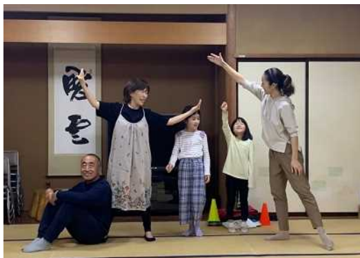
演劇ワークショップの様子