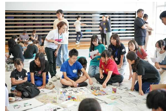
こころのままアートワークショップ