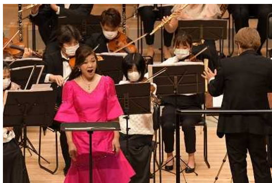
ソプラノ独唱の様子