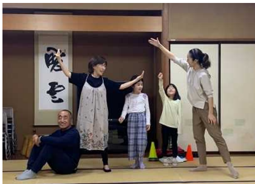
演劇ワークショップの様子