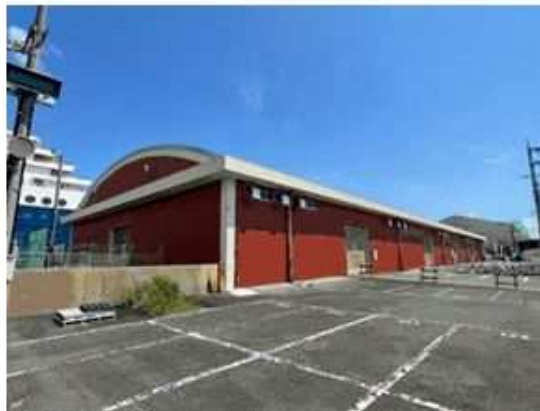
○旧4号上屋(物流施設として過去利用)