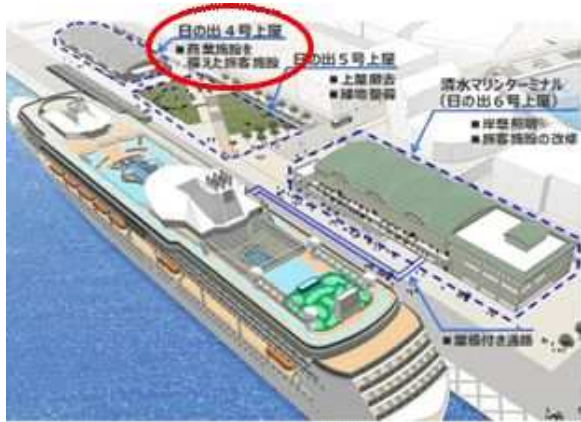
○クルーズ拠点整備のイメージ図