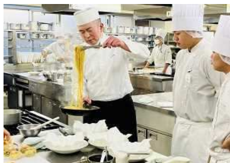
過去の授業の様子（生産現場訪問） 過去の授業の様子（調理実習）