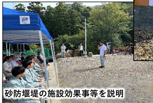
砂防堰堤の施設効果事等を説明