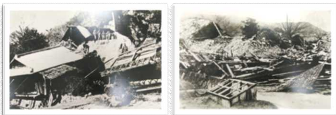
北伊豆地震 旧中伊豆町の被災状況