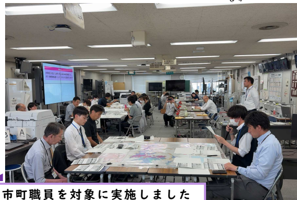
市町職員を対象に実施しました