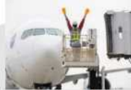
マーシャリング (航空機をエプロンの所定の位置 まで誘導すること)