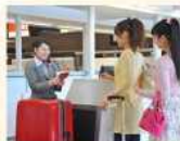
旅客の搭乗のための 役務提供 預入手荷物受取り