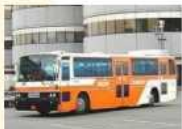
旅客の搬送 (ランブバス)