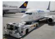
航空機トローイング (車両等を用いて航空機 を牽引すること)