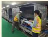
預入手荷物のコンテナ等 への積付け