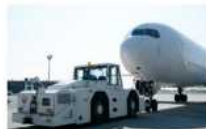
航空機フックアップ (車両等を用いて航空機を後方に 押し出すこと)