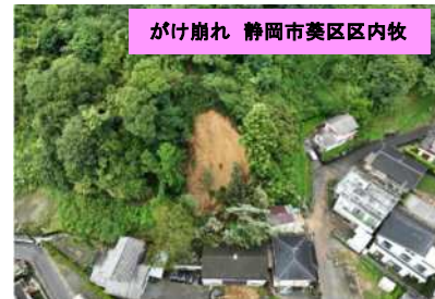
災害関連事業(急傾斜)を申請予定