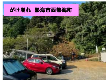
災害関連事業(急傾斜)を申請予定