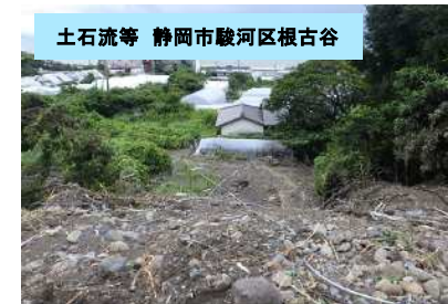
治山、農地部局で対応を検討中