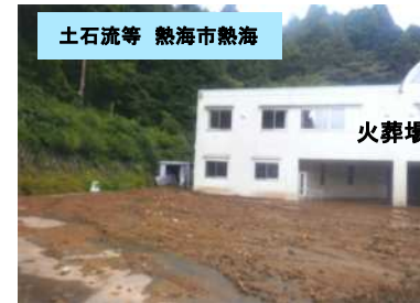
治山、道路部局で対応を検討中