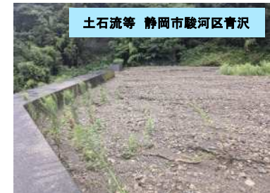
殿谷川(施設効果有)