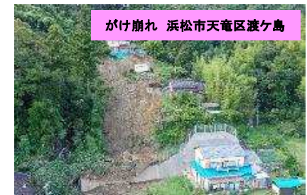
災害復旧事業で対応予定(施設効果有)