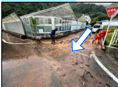
土石流等 伊豆市八木沢