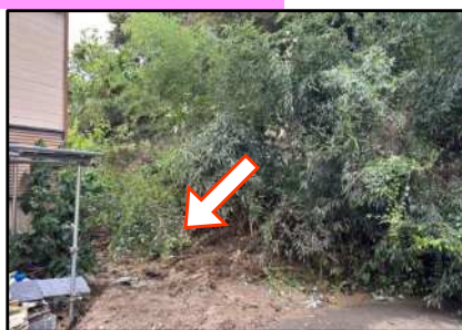
がけ崩れ 菊川市下内田