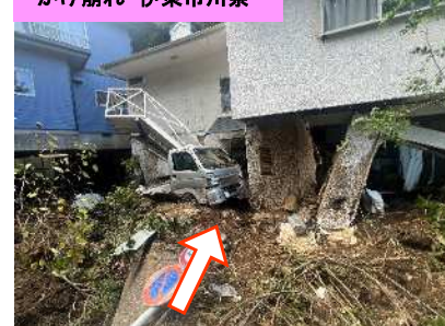
がけ崩れ 伊東市川奈