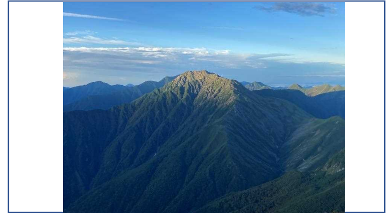
撮影年月：2022年9月 悪沢岳からみる赤石岳