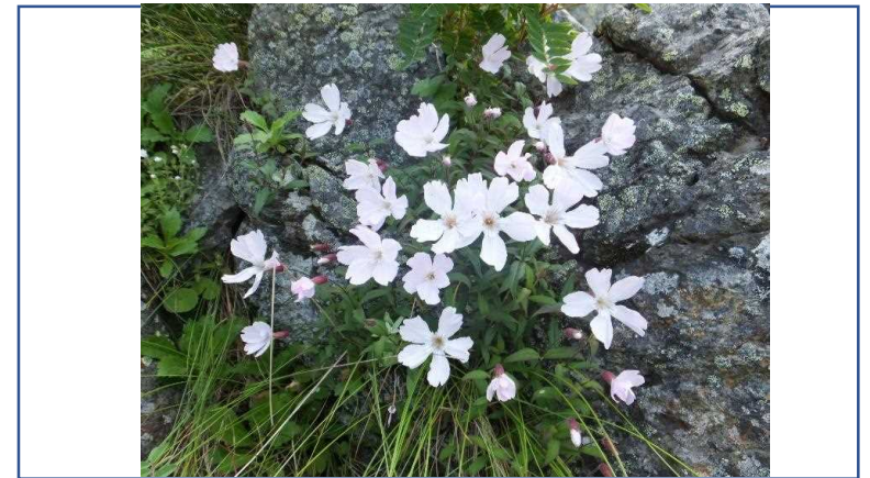
撮影年月：2013年8月 千枚岳のタカネビランジ