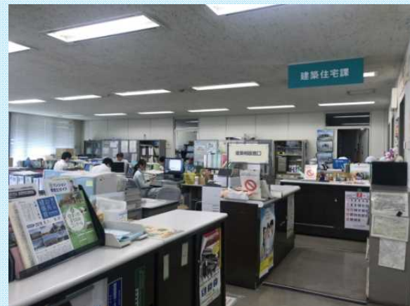
静岡土木事務所の窓口