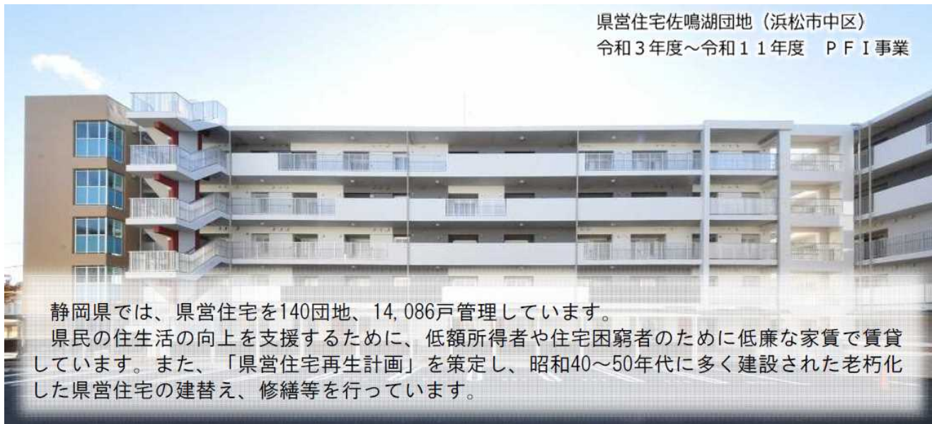
県営住宅佐鳴湖団地（浜松市中区） 令和3年度～令和11年度 PFI事業

静岡県では、県営住宅を140団地、14,086戸管理しています。 県民の住生活の向上を支援するために、低額所得者や住宅困窮者のために低廉な家賃で賃貸しています。また、「県営住宅再生計画」を策定し、昭和40～50年代に多く建設された老朽化した県営住宅の建替え、修繕等を行っています。