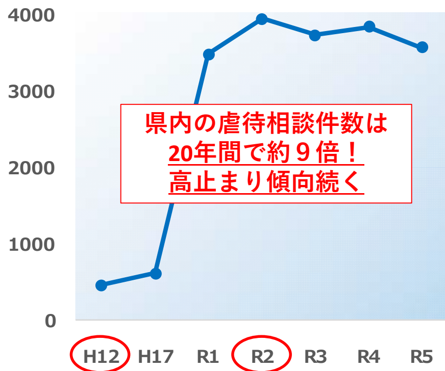
児童虐待相談件数の推移 (静岡県)

増加傾向にある 児童虐待相談 への対応も重要な業務です。 児童虐待の通告対応として、 市町の児童福祉担当課などの 関係機関と連携 を図り、 児童とその家族を支援します。