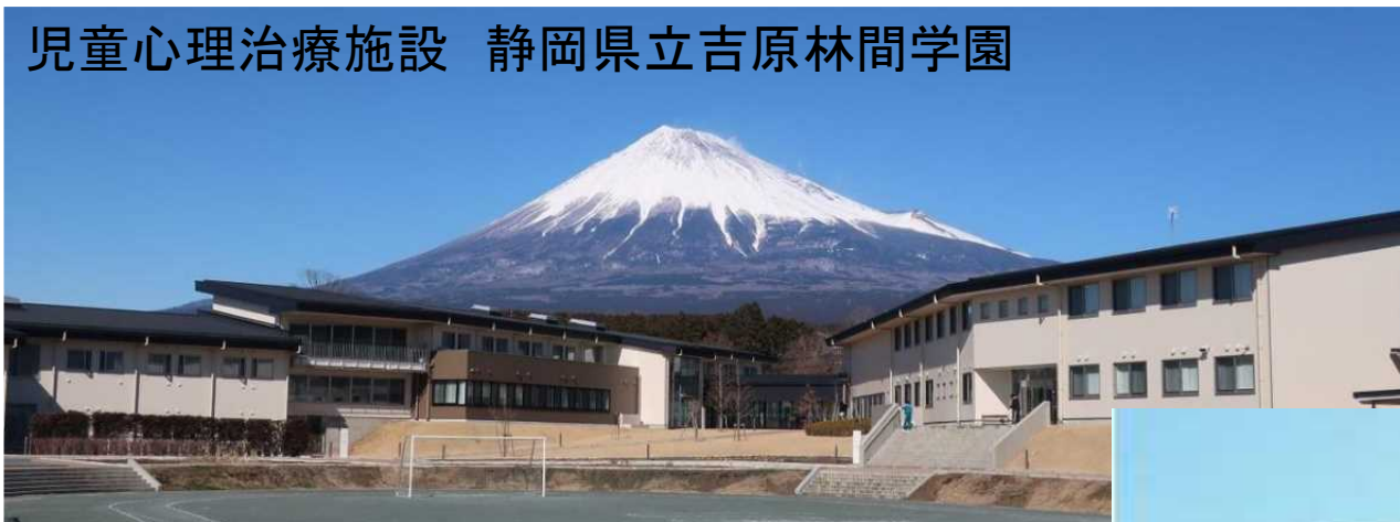
児童心理治療施設 静岡県立吉原林間学園

児童やその家族に対する心理アセスメント、カウンセリング等に携わり、相談対象者等の健全な成長、生活を支援します。