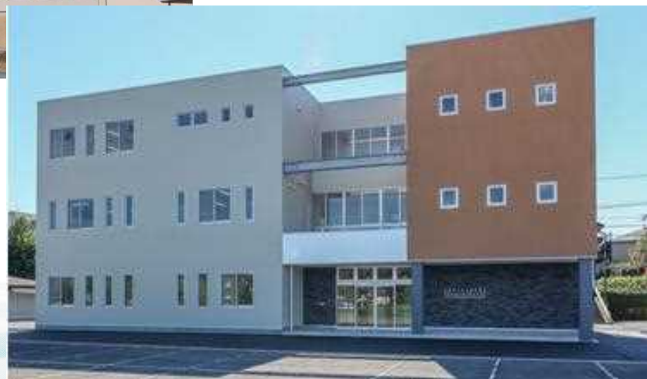
静岡県中央児童相談所(静岡県知的障害者更生相談所)