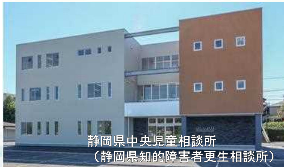
静岡県中央児童相談所 (静岡県知的障害者更生相談所)