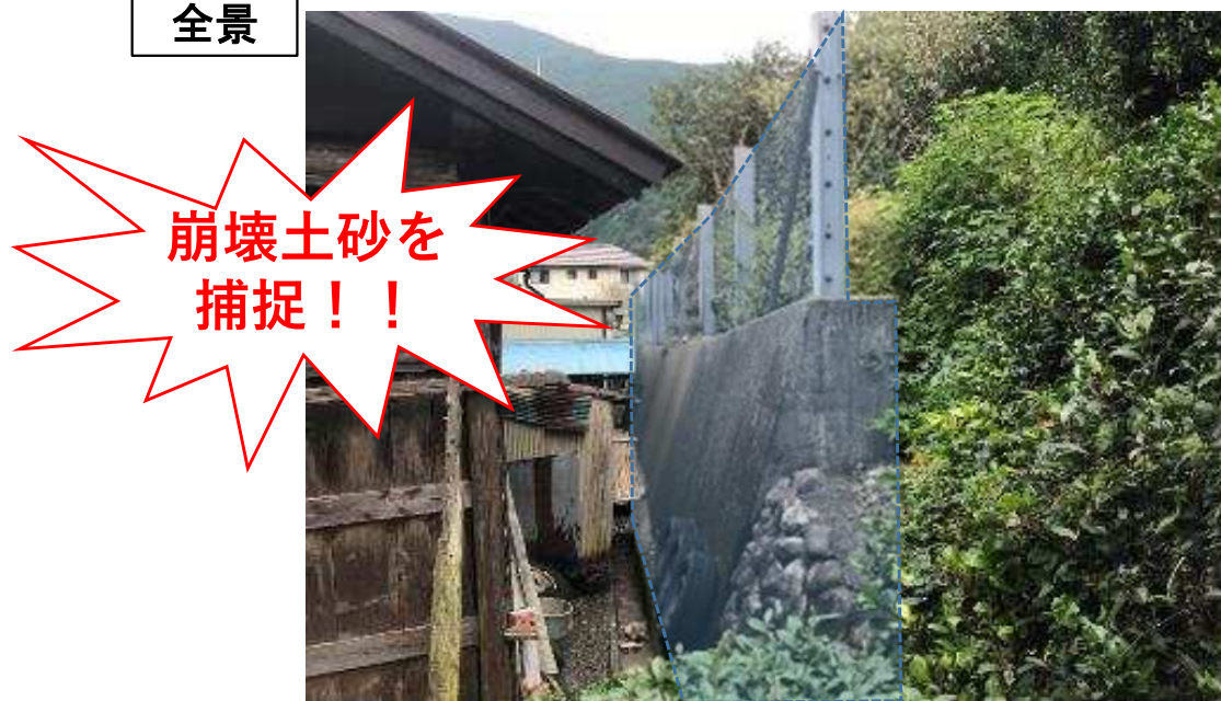
急傾斜地崩壊防止施設（落石防護柵及び擁壁）