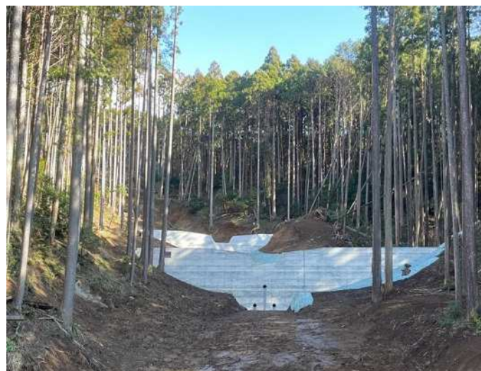
治山工事（溪間工）の実施により土砂流出を防止