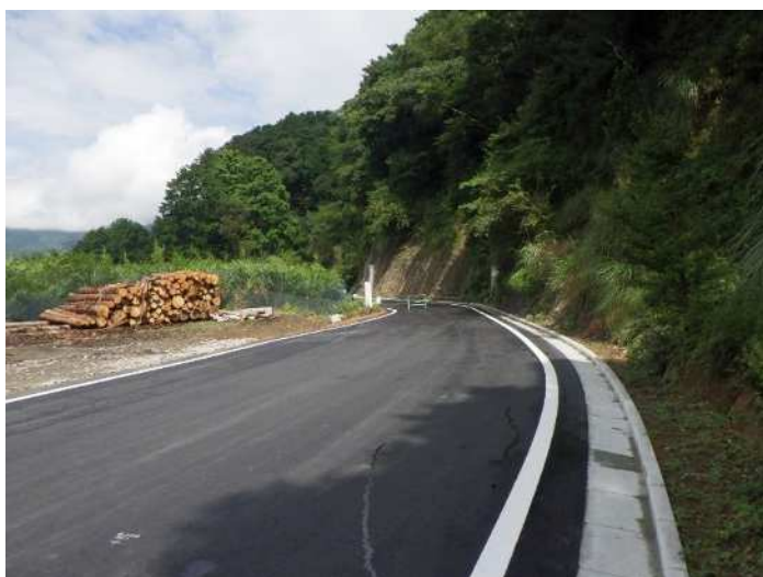
路網整備により森林整備を促進