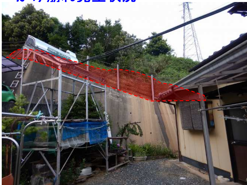
急傾斜地崩壊防止施設（落石防護柵及び擁壁）