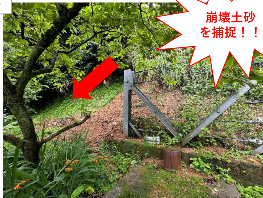
急傾斜地崩壊防止施設 (落石防護柵及び擁壁)