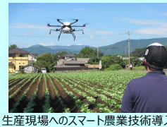
生産現場へのスマート農業技術導入