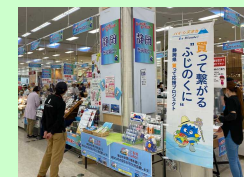
「バイ・シズオカ」県民運動の推進

<成果指標> バイ・シズオカ、バイ・ふじのくに、 バイ・山の洲の取組に参加した 県民の割合 59%(2021年度) ⇒70%(2025年度) 緑茶出荷額全国シェア 55.6%(2019年度) ⇒60%(2025年度) 花き県内流通額 103億円(2019年度) ⇒120億円(2025年度)