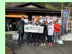
農村マイクロツーリズムの推進

<成果指標> ふじのくに美しく品格のある邑づ くりの参画者数 73,058人(2020年度) ⇒87,600人(2025年度) 鳥獣による農作物被害額 297百万円(2020年度) ⇒270百万円(2025年度)