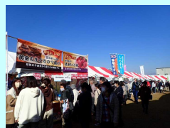
山の洲への新たな商流・物流網の構築