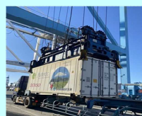
清水港等を拠点とした輸出

<成果指標> 農業生産関連事業の年間販売額 1,138億円(2019年) ⇒毎年度1,100億円 山の洲3県への流通金額 41億円(2020年度) ⇒50億円(2025年度) しずおか食セレクション販売額 440億円(2020年度) ⇒500億円(2025年度) 清水港の食料品の輸出額 225億円(2020年度) ⇒350億円(2025年度)