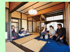
「世界お茶まつり」の開催