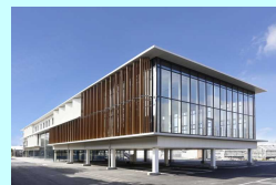
農林環境専門職大学におけるプロフェッショナル人材育成

<成果指標> 持続可能な農業経営体数 4,163経営体(2019年度) ⇒4,400経営体(2025年度)