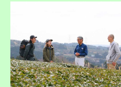
「ガストロミーツーリズム」の推進 (例：茶やその文化に触れるツーリズム)