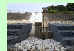
ため池等による防災減災対策の推進