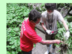
世界農業遺産を活用した交流促進