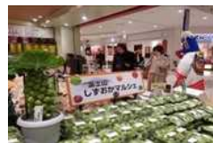
首都圏での富士山しずおかマルシェの開催