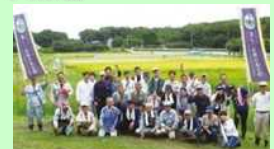
ふじのくに美しく品格のある邑づくり