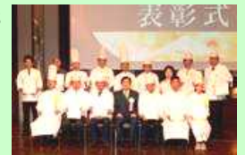
ふじのくに食の都づくり仕事人