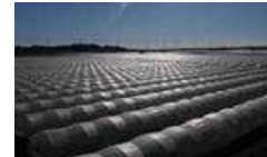
地下水水位制御システムによる水田の高度利用