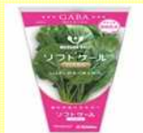
ソフトケールGABA (AOIプロジェクト初の成果)