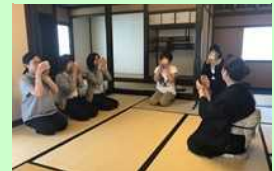
ふじのくに茶の都ミュージアム