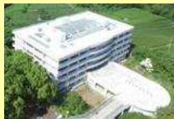
AOI-PARC (アオイパーク) ※ Agri Open Innovation Practical and Applied Research Center