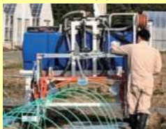
茶園管理機をベースに開発されたレタス用管理機