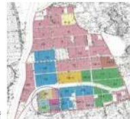
担い手への農地集積の推進