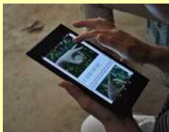
栽培技術を情報端末で学習