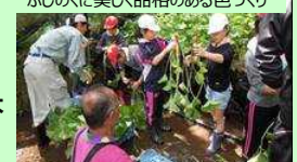
小学生のわさび植え付け体験