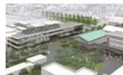
専門職大学の新校舎(イメージ)