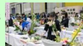
高校生を対象としたフラワーデザインコンテスト