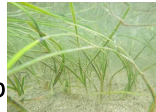
自生が確認されたアマモ類 (御前崎港：2017年)