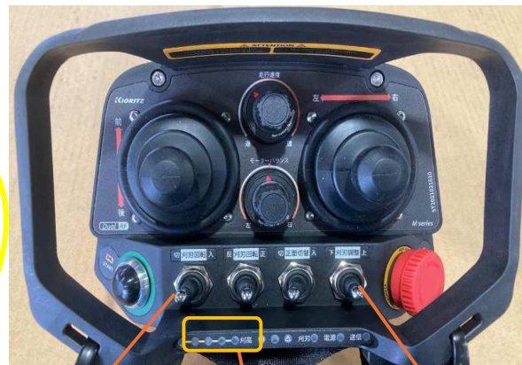
①刈刃回転スイッチ