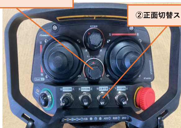
②正面切替スイッチ