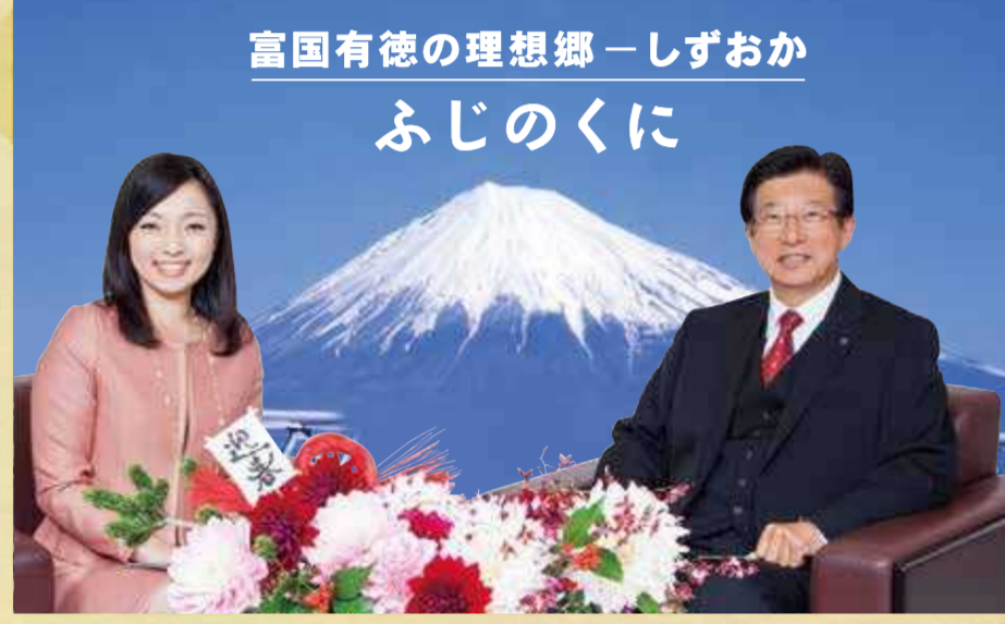
富国有徳の理想郷—しずおか ふじのくに

知事 防災のお話が出たところで、昨年8月、国が南海トラフ巨大地震の被害想定を公表しましたが、危機管理へのお考えはいかがでしょう。