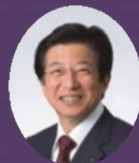
静岡県知事 川勝平太