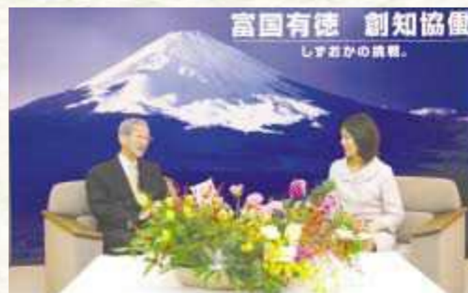
■バラ、ガーベラ、コチョウランなど静岡県産の花が飾られました

知事 開港の効果は二つ期待できます。一つは、利便性の向上による経済・産業界の効果です。もう一つは、なんと言っても観光客の増加ですね。これまで静岡県を通り過ぎるだけだった人たちが空港を出入り口にして、県内を観光することが期待できます。そのために、魅力的な観光ルートを開発、情報発信し、多くの人に利用してもらうことが大事です。県は英中簡体字・繁体字・韓の4言語の接遇マニュアルを作り、現在、観光協会と一緒に、旅館・ホテル、飲食店に対して、おもてなしの水準の向上に取り組んでいます。