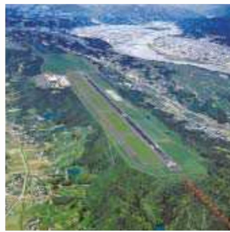
●富士山静岡空港完成予想図

富士山静岡空港が平成21年3月開港 原田 明けましておめでとうございませう。 知事 おめでとございませう。 原田 さて新年を迎え、県政運営の基本方針を伺いたいと思います。まず、近年最大のプロジェクト、富士山静岡空港について教えてください。 知事 いよいよ平成21年3月に開港します。空港を核にした魅力ある静岡県づくり、具体的には都市機能を高め、地域の発展につなげたいと思います。 原田 離着陸の景観が、あれほど素晴らしいです。