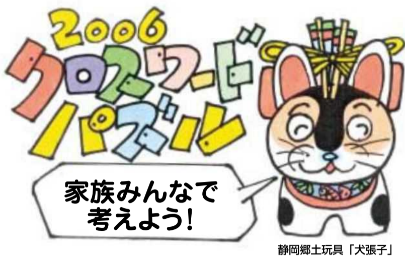
静岡郷土玩具「犬張子」

□のA～Eの5文字をつなげると、あるもの の名前になります。さて、なんでしょう。