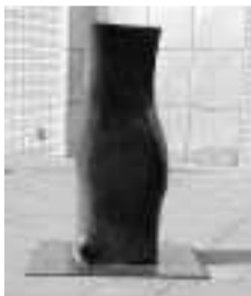
大賞受賞作品 「海にもぐる鯨のように」 作者:中谷聡

2年に1度の県内最大公募展。入賞13点を含む作品174点を公開 とき/1月2日(日)~30日(日) 開館時間/10時~17時30分(展示室への入場は閉館の30分前まで) 1月の休館日/1日(土・祝)と月曜日(10日は開館、翌11日は閉館) 料金/一般・大学生500円、小・中・高生200円、70歳以上無料 問合せ/県立美術館 ☎054(263)5755