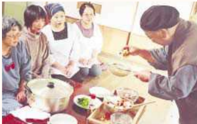
作り方を住職から熱心に学ぶ、会の皆さん