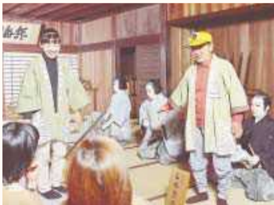
楽しく歴史が学べます

同会では、紀伊国屋に伝わる旅籠の食事をもとにした「紀伊国屋道中弁当」の開発も行い、現在紀伊国屋資料館で予約を受け付けています。皆さんもぜひ郷土色豊かな案内人の説明とお弁当を楽しみながら、新居宿の史跡をゆっくり散策してみてください。