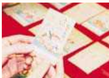
色彩も見事な百人一首