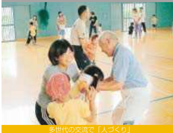
多世代の交流で「人づくり」