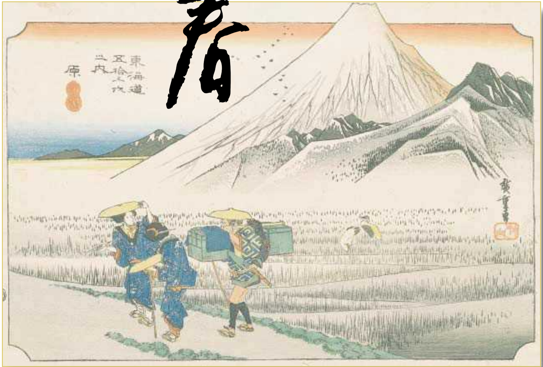
歌川広重 東海道五拾三次(保永堂版) 原 朝之富士