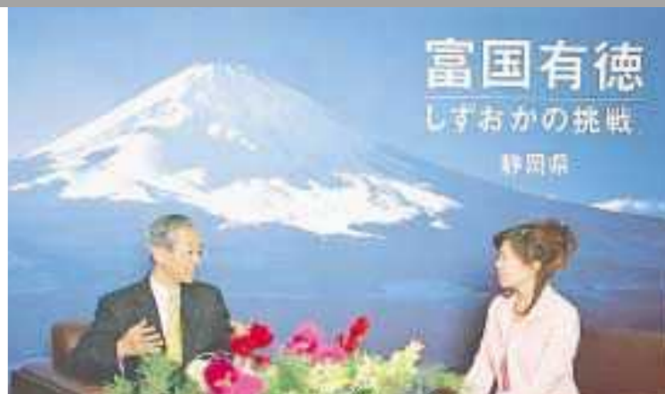
富国有徳 しずおかの挑戦 静岡県