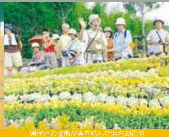
県民との協働が実を結んだ浜名湖花博