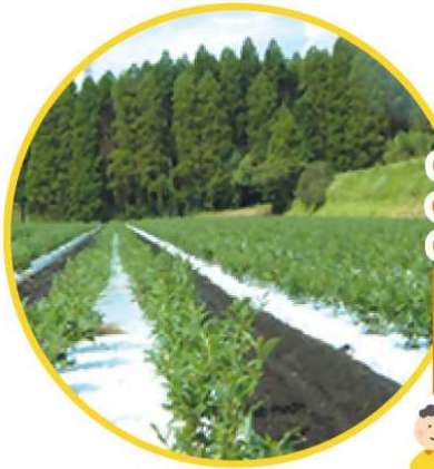
つゆひかりへ改植