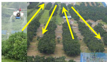
図1 無人ヘリの散布ルート