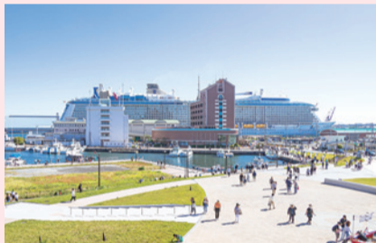
▲大型クルーズ船の乗客や見物客でにぎわう清水港

清水港日の出埠頭では、今年3月に岸壁改良工事が完成し、大型のクルーズ船や貨物船2隻の同時接岸が可能になりました。今後もさらに多くのクルーズ船の寄港が見込まれます。江尻埠頭では、新たな駿河湾フェリー乗降場の整備が進み、魚市場のリニューアルも予定されており、さらなるにぎわいを生み出していきます。