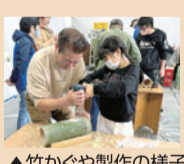
▲竹かぐや製作の様子

地域と協働で「竹かぐや」を製作し、富士川橋をライトアップするなどのイベントを実施していきます。