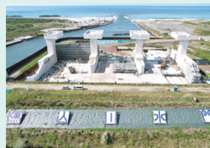
▲建設中の水門と県立浜松江之島高等学校美術部の生徒がデザインしたPR看板