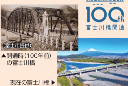
▲開通時(100年前)の富士川橋

大正13年に架けられた富士川橋が開通100周年を迎えました。点検や補修を繰り返しながら昭和、平成、令和へと歴史を刻んできた橋は、今後も地域の交通と暮らしを支えていきます。