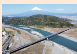
▲富士川かりがね橋

富士川かりがね橋が新たに架けられたことで、慢性的に混み合っていた富士川橋の交通量が減って渋滞が緩和され、地域の移動が便利になりました。