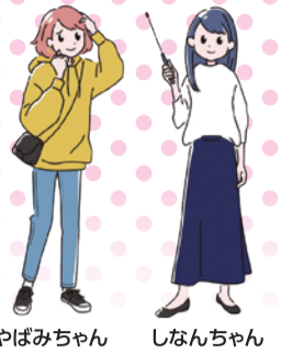
やばみちゃん しなんちゃん