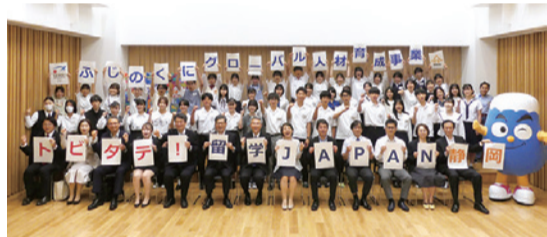
▲事前オリエンテーション ▲壮行会(第1期生と支援団体の皆さまとの集合写真)