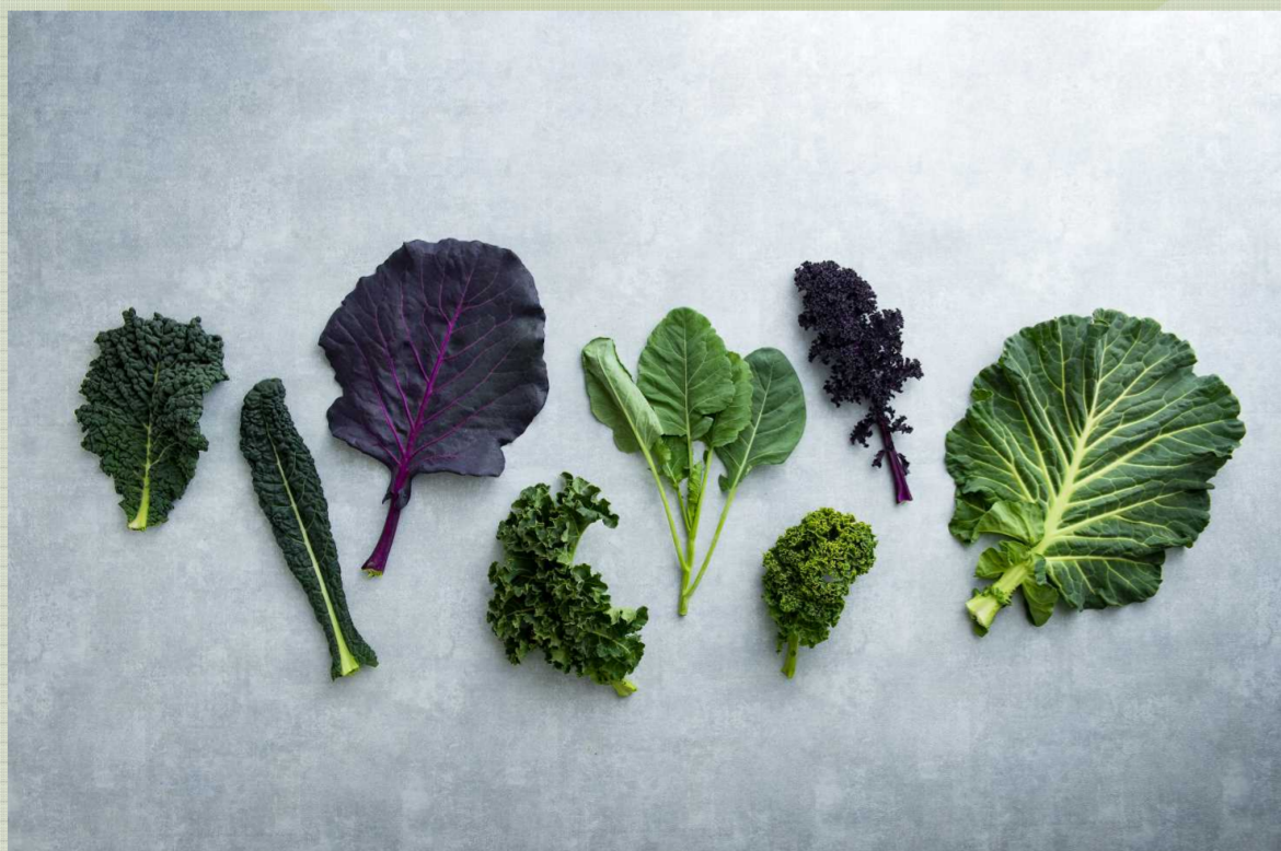
Kale varieties of Masuda Seed 増田採種場のケール品種