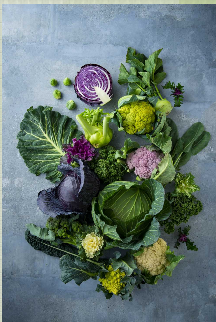
アブラナ科野菜 Brassica vegetables

増田採種場が主に取り組むSDGs 品種開発を始めとする企業活動によって、サステナブルな社会の実現に取り組んでいます。 「2 飢餓をゼロに」「3 すべての健康と福祉を」 「9 産業と技術革新の基盤をつくろう」 「13 気候変動に具体的な対策を」