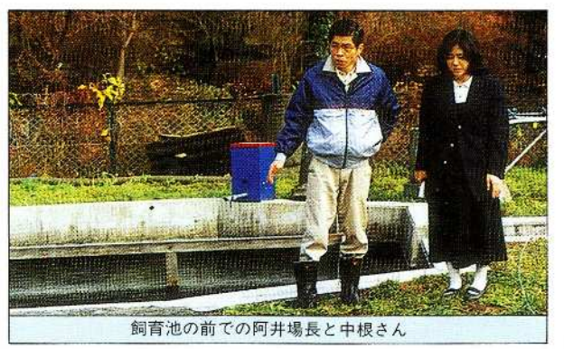
飼育池の前での阿井場長と中根さん