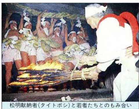
松明献納者(タイトボン)と若者たちとのもみ合い

富士宮市猪之頭にある水産試験場「富士養鱒場」。澄んだ空気と緑の中、鱒たちの飼育池が周囲の風景に溶けこんで美しく点在しています。 創立以来五十余年の長い歴史を持つこの養鱒場の主な事業は、養鱒業者などへ卵や稚魚を供給する種苗生産部門と、魚の病気や飼育環境などの研究を行う試験研究部門とに分かれています。 鱒は本来秋から冬にかけて産卵し、約一年で成長し、出荷されます。ところが近年、春から夏にかけての需要が増してきました。そこで富士養鱒場では冬場の電気照明によって魚の季節感を人工的に調節したり、一度採卵した親魚に