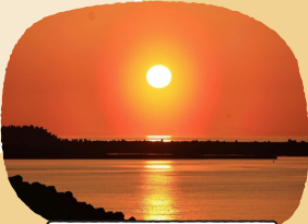
日本海に沈む夕日