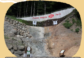
フォッサマグナパーク