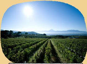
ぶどう畑からの眺望