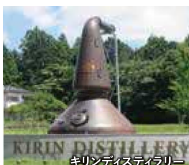
キリンディスティラリー キリンディスティラリー

富士山の伏流水を利用して、ウイスキーの仕込みからボトリングまでを一貫して行っている蒸溜所に立ち寄ります。