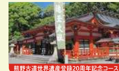
熊野古道世界遺産登録20周年記念コース