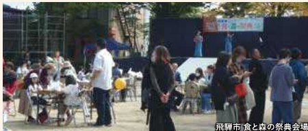
飛騨市食と森の祭典会場

飛騨古川の町並みを見下ろす「気多若宮神社」や地元の酒蔵を巡るほか、飛騨のグルメやイベントが盛りだくさんの「飛騨市 食と森の祭典」をお楽しみください。