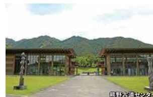
熊野古道センター

倉庫をリノベーションした「おわせマルシェ」で物販や食事を楽しんでいただき、熊野古道の歴史や自然、文化を体感できる「三重県立熊野古道センター」を巡ります。