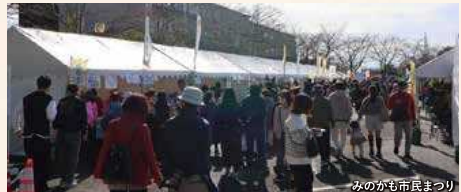
みのかも市民まつり

「ぎふ清流里山公園」を会場に約60店舗が出店する「みのかも市民まつり」。地元のグルメやステージイベントをお楽しみください。