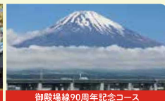
御殿場線90周年記念コース