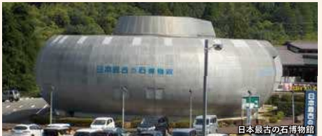
日本最古の石博物館

上麻生駅には、ローカル線の花形として地域の人々に愛された蒸気機関車C12が展示されています。また、飛騨川から見える飛水峡では、国の天然記念物に指定されている大自然の造形美を満喫できます。