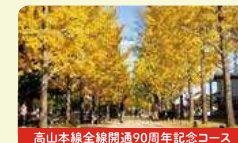
高山本線全線開通90周年記念コース