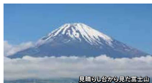
見晴らし台から見た富士山

連続勾配区間に位置する富士岡駅。SLが発着していた当時の、水平な待避線を利用した「スイッチバック式」の跡地を見学できます。