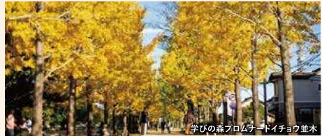
学びの森プロムナードイチヨウ並木

「学びの森プロムナード」は毎年11月下旬に約70本のイチヨウが一斉に紅葉する並木道。「蘇原自然公園」でも紅葉のほか、小鳥のさえずりや滝の音を耳にしながら園内の散策をお楽しみください。