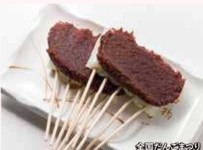
全国だんごまつり

「全国だんごまつり」が5年ぶりに開催。厄除けだんごをはじめ、全国の名物だんごが集結します。