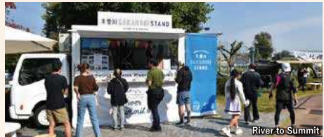
River to Summit

自然豊かな町の中を、木曾川を間近に感じながら散策します。コース途中の「RIVER PORT PARK」では「River to Summit 2024」のイベントが開催され、ミニライブやキッチンスタンドをお楽しみいただけます。