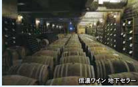
信濃ワイン 地下セラー

スタートゴール 中央本線・塩尻駅 スタート受付 8:30~11:15 コース距離 約8.5km