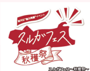
スルガフェス～秋穫祭～