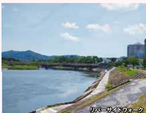
リバーサイドウォーク

豊川リバーサイドウォークを歩き、多くのうなぎ店舗が集まる「うなぎサミットinとはし2024」をお楽しみください。