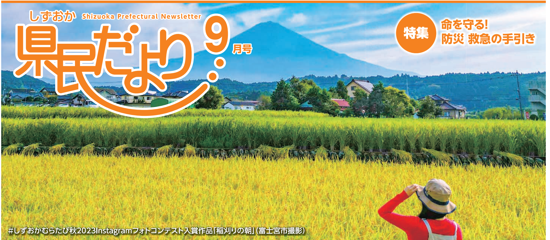
#しずおかむらたび秋2023Instagramフォトコンテスト入賞作品「稲刈りの朝」(富士宮市撮影)