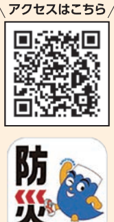
アクセスはこちら

緊急防災情報が受信できる他、ハザードマップの確認や避難トレーニング、学習コンテンツなどさまざまな機能が備わっています。ぜひアプリのダウンロードを!