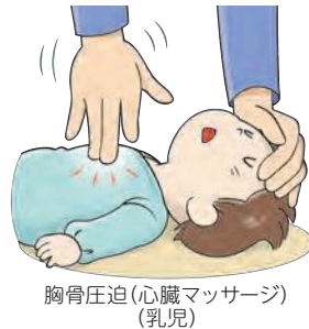
胸骨圧迫(心臓マッサージ) (乳児)