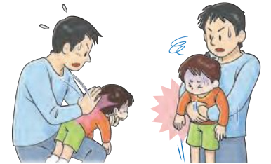
図1: 背部叩打法 (幼児)

幼児にはこどもの後ろから片手を脇の下に入れて、胸と下あご部分を支えて突き出し、あごをそらせます。片手の付け根で両側の肩甲骨の間を強く迅速に叩きます(図1)。乳児には片腕にうつぶせに乗せ顔を支えて、頭を低くして、背中の中を平手で何度も連続して叩きます(図3)。