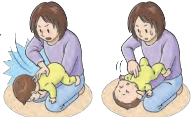
図3: 背部叩打法 (乳児)

片手で体を支え、手の平で後頭部をしっかり支えます。心肺蘇生法の胸部圧迫と同じやり方で圧迫しましょう(図4)。